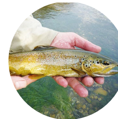
Trucha fario o comuna ( Salmo trutta fario )