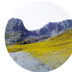
Collado dels Isards