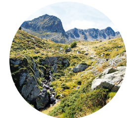
Camino de les Abelles

El lago de les Abelles es la cabecera de la cuenca del río del Pas de la Casa, que es un afluente de la Garona. Este río es, al mismo tiempo, una frontera natural que delimita el territorio andorrano con Francia, por lo que tiene una parte francesa y otra andorrana.