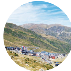
El Pas de la Casa