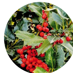
Acebo común ( Ilex aquifolium )