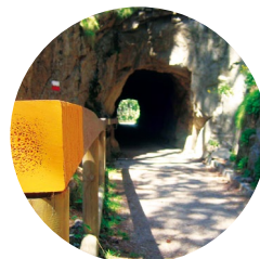
Túnel en el camino dels Matxos

Fontverd: Nombre compuesto de font -fuente, en castellano-, del latín fons , y de verd -verde, en castellano-, del latín viride . En efecto, en la comarca hay nacimiento de aguas sobre el zócalo granítico -filtrador- y esto hace del lugar un jardín espontáneo por la abundancia de plantas.