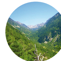
Valle del Madriu

El itinerario de Fontverd pasa por el Valle del Madriu-Perafita-Claror, declarado Patrimonio de la Humanidad por la Unesco en el año 2004. Es una caminata de escaso desnivel apta para ir en familia y para gozar de unos paisajes extraordinarios.