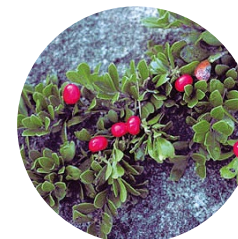
Gayuba ( Arctostaphylos uva-ursi )