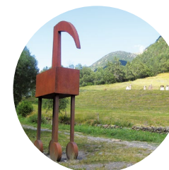
Escultura de la Ruta del Ferro

Jacint Verdaguer fue, además de sacerdote, uno de los escritores más importantes en lengua catalana del Renacimiento catalán. Nacido en Folgueroles en el año 1845, fue hijo de una familia modesta, pero no inculta, y rápidamente descubrió su interés por la tradición popular. Durante su internado en el seminario de Vic, donde cursó la carrera eclesiástica, se familiarizó con la retórica y los clásicos y se involucró en la escritura poética. Entre sus títulos destacan las poesías épicas de estilo romántico, l'Atlàntida y Canigó , y las colecciones poéticas Idil·lis i cants místics , Pàtria , Montserrat , Flors de calvari y Aires del Montseny . En prosa publicó Excursions i viatges , Dietari d'un pelegrí a Terra Santa , una colección de rondallas y la serie de artículos publicados en prensa.