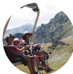
Telesilla de Creussans