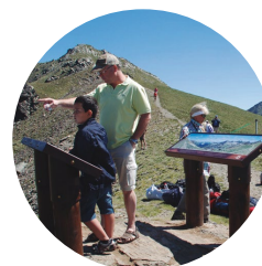
Paneles de orientación