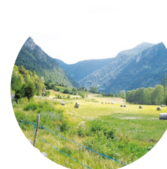
Campos de hierba para guardar en Arans