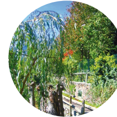
Rec del Solà