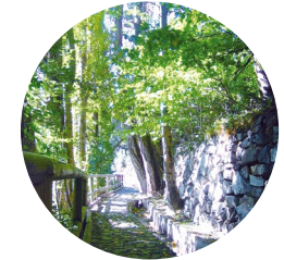
Hilera de chopos

Hasta la fecha, las acequias del Solà y del Obac (que se encuentra en la parte sombría de Andorra la Vella) han dado y dan la posibilidad de que, a escasos metros del núcleo urbano, los ciudadanos puedan ir a practicar deporte, a pasear, a contemplar el pueblo desde una perspectiva adecuada para captar su crecimiento, o simplemente a descargar el estrés que supone la dinámica urbana.