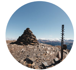
Pic de l'Estanyó

L'itinéraire présenté nous permet d'atteindre le majestueux pic de l'Estanyó (2 915 m). Ce parcours exigeant de 1 135 m de dénivelé nous permet de découvrir le Parc naturel de la vallée de Sorteny et atteindre l'un des sept pics d'Andorre dépassant les 2 900 m qui, grâce à sa situation privilégiée, en fait un point de vue exceptionnel sur les plus hauts pics des Pyrénées.