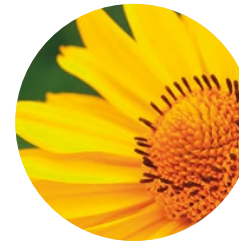
Arnica ( Arnica montana )