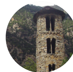
Église Santa Coloma

Cet itinéraire circulaire à la fois exigeant et spectaculaire nous permet de découvrir la vallée d'Enclar. Classée réserve de chasse gardée en 1987, elle abrite une faune de grande valeur. C'est là que vit en effet la plus importante population d'isards de la Principauté, tant en termes d'extension de territoire que de quantité d'individus.