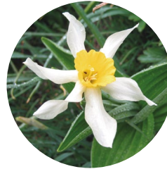
Narcisse jaune ( Narcissus Pseudonarcissus )

Laurèdia : D'après Joan Coromines, laurèdia est l'ancien nom de « Lòria » (Sant Julià de Lòria) qui, d'après l'acte de consécration de la cathédrale de La Seu d'Urgell de 839, serait le nom de personne latin Lauridius , tout en tenant compte également de « Salòria », qui semble présenter la même dénomination et où l'utilisation de l'article indiquerait ici un mot faisant référence à l'eau.