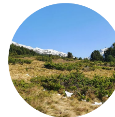
Pla de Bordetes