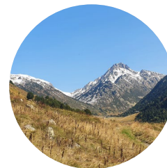
Pic de Juclà