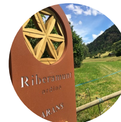
Panneau de Riberamunt