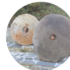
Roues de moulin

Le circuit allant de l'église de Santa Bàrbara au refuge Borda de Sorteny est un itinéraire linéaire d'environ 12 km qui relie les villages d'Ordino et d'El Serrat, et nous emmène finalement au refuge gardé de Sorteny, situé dans le Parc naturel de la vallée de Sorteny. Il s'agit d'une longue excursion, toutefois accessible car elle présente un faible dénivelé. C'est une bonne option pour découvrir les villages de la paroisse d'Ordino.