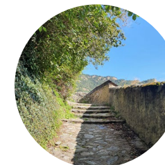
Chemin de pierres

La Boucle Verte de La Massana est un itinéraire circulaire qui évolue de manière naturelle autour de la paroisse de La Massana. Elle sillonne des attraits d'une grande valeur écologique, paysagère, historique et culturelle, et permet d'apprécier les alentours de la paroisse. Bien qu'il s'agisse d'un itinéraire de difficulté moyenne, il nous permettra de découvrir les villages de Sispony et d'Escàs et de rencontrer certains de nos producteurs locaux : El Pastador à Sispony, qui élabore des confitures et des marmelades, ou la visite de la fromagerie Casa Raubert qui propose des fromages artisanaux au lait de brebis.