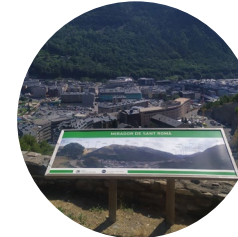
Mirador de Sant Romà dels Vilars

Une balade à la fois simple et courte qui vous fera traverser Els Vilars, l'un des villages de la paroisse d'Escaldes-Engordany. L'itinéraire vous permettra de découvrir certaines constructions anciennes. Des bordas de montagne traditionnelles ou encore des maisons seigneuriales qui ont été réaménagées en logements pour les habitants d'Escaldes.