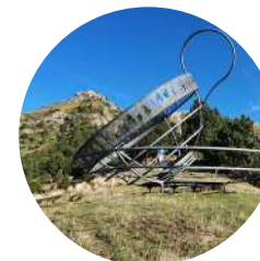
Tempête dans une tasse de thé