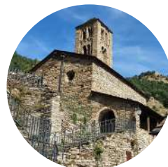
Sant Climent de Pal

Turer : nom dérivé de « haut » et ses congénères, ou de « turo », sorte de pierre ponce.