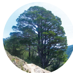
Pi roig centenari ( Pinus sylvestris )