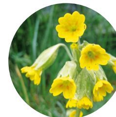
Cucut ( Primula veris )