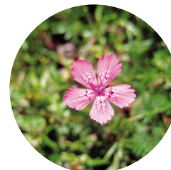
Clavellet ( Dianthus deltoides )