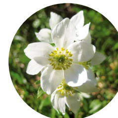
Anémone à fleurs de narcisse ( Anemone narcissiflora )