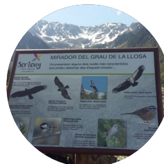
Mirador del Gran de la Llosa