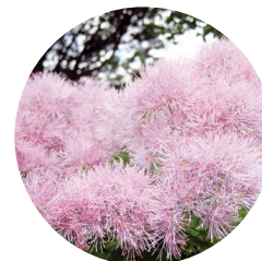
Pigamon à feuilles d'ancolie ( Thalictrum aquilegifolium )