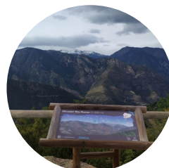
Mirador riu Runer

Roca vient d'un mot pré-romain rocca , signifiant roche et dont on ignore l'origine exacte. Et fort , du latin forte , dans le sens de « résistant, difficile à prendre, qui se résiste avec force à se laisser prendre ».