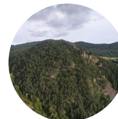
Chemin du mirador de la rivière Runer

Le chemin de Rocafort est situé sur la route de Fontaneda, dans la paroisse de Sant Julià de Lòria. Du sommet, la montagne nous offre une vue fantastique sur la paroisse à vol d'oiseau.