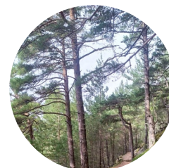
Camí mirador riu Runer