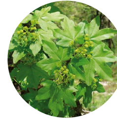
Érable champêtre ( Acer campestre )