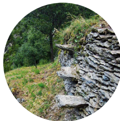
Escaliers en pierres sèches

La senyoreta : Du latin seniore , "vieux homme, personne ayant de l'autorité", qui a donné seigneur et ses dérivés. Ici, toponyme avec le sens de demoiselle qui a une certaine distinction. Provient d'une belle légende régionale dans laquelle une demoiselle d'une grande beauté a le premier rôle, selon les différentes versions.