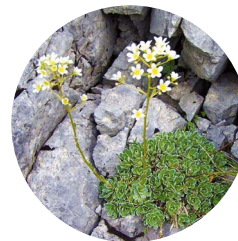
Saxifrage paniculée ( Saxifraga paniculata )