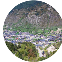
Vues sur Encamp