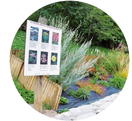
Circuit d'interprétation botanique

Ce chemin facile, idéal pour un après-midi d'été, se trouve dans la paroisse d'Encamp. Il fut construit pour y faire passer, en-dessous, la canalisation d'eau qui approvisionne le lac d'Engolasters, qui provient de la retenue de Ransol, dans la paroisse de Canillo. C'est FHASA, l'ancienne centrale électrique d'Andorre, aujourd'hui dénommée FEDA, qui a fait construire cette canalisation.