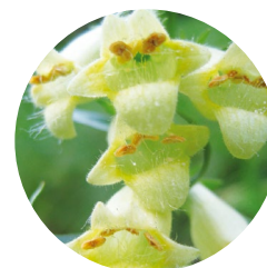
Digitale jaune ( Digitalis lutea )