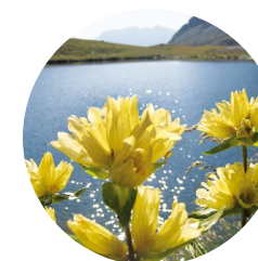
Gentiane de Burser ( Gentiana burseri )

La vallée de l'Angonella, située au beau milieu des montagnes d'Ordino, est l'un des rares paysages encore vierges de la Principauté d'Andorre et un espace naturel précieux grâce à son contenu et à sa conservation. À cause de la difficulté du parcours, ses lacs sont restés inaltérés et inhospitaliers, à l'écart de la massification et des routes habituelles.