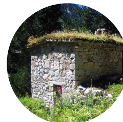
Cabane de la Farga