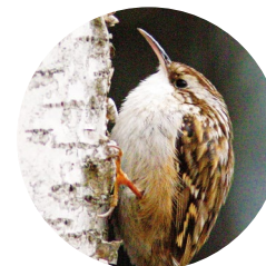
Grimpereau des jardins ( Certhia brachydactyla )