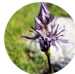
Swertia pérenne ( Swertia perennis )