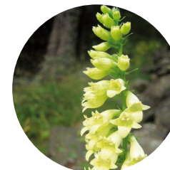
Digitale jaune ( Digitalis lutea )