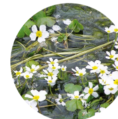
Ranunculus aquatilis ( Ranunculus aquatilis )

La vallée qui s'ouvre sur la droite en montant le Port d'Envalira en direction de la France, dans de la Paroisse d'Encamp, cache un parcours très intéressant qui passe par une succession de lacs communicants –certains de ces lacs n'ont pas de nom–, de ruisseaux, de falaises rocheuses, de prés et de panoramas à perte de vue, tout cela au coeur du plus grand cirque glacier granitique de la Principauté d'Andorre. Le GR7 et le GRP ont en partie le même tracé dans ce cirque, couronné de sommets de plus de 2.700 mètres, comme c'est le cas du col dels Pessons, qui s'élève à 2.810 m.