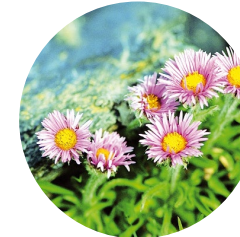
Vergerette à une fleur ( Erigeron uniflorus )