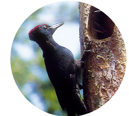
Pic noir ( Dryocopus martius )

Le pic de Comapedrosa est le plus haut sommet d'Andorre. Il se trouve dans le Parc naturel communal des vallées du Comapedrosa, d'une superficie protégée de 1 542,6 hectares (15,42 km 2 ). Il est situé à Arinsal, dans la paroisse de La Massana.