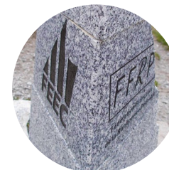
Bornes de la Portella