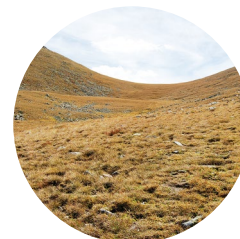
Cirque dels Colells