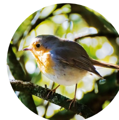
Rouge-gorge ( Erithacus rubecula )