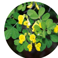
Coronille des jardins ( Coronilla emerus )