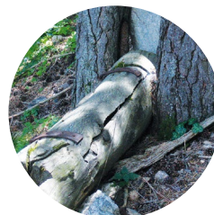
Abreuvoir sur le chemin