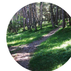
Chemin du bois de la Palomera

Prat Primer se trouve au centre d'Andorre.