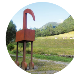
Sculpture de la Route du Fer

En plus d'être chapelain, Jacint Verdaguer fut l'un des principaux auteurs de langue catalane de la Renaissance Catalane. Né à Folgueroles en 1845, dans une famille modeste, mais pas inculte, il découvrit rapidement son intérêt pour la tradition populaire. Lors de son internat au séminaire de Vic, où il fit ses études ecclésiastiques, il se familiarisa avec la rhétorique et les Classiques, et il se lança dans l'écriture poétique. Parmi ses oeuvres, on retient les poésies épiques de style romantique, l' Atlàntica et Canigó , ainsi que les recueils poétiques Idil·lis i cants místics , Pàtria , Montserrat , Flors de calvari et Aires del Montseny . En prose, il publia