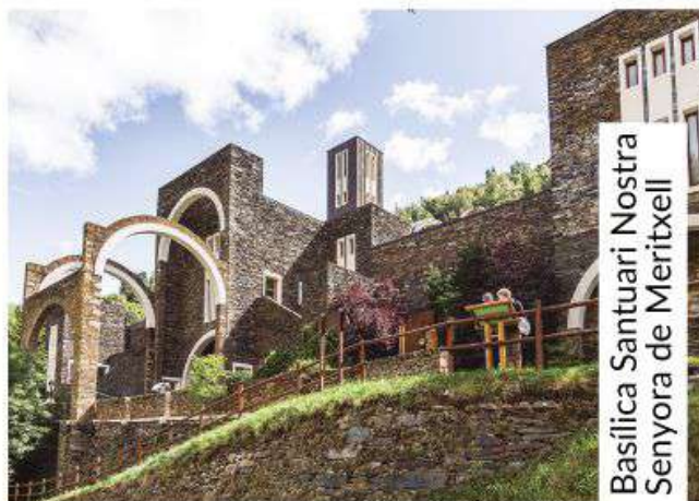
Basílica Santuari Nostra Senyora de Meritxell