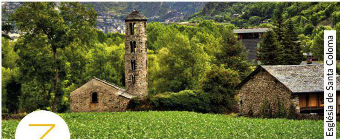
Església de Santa Coloma