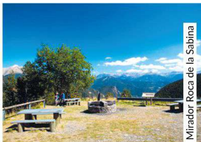
Mirador Roca de la Sabina